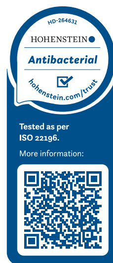
Exemple : certification pour Eurodekor

Nos produits sont fabriqués sans ajout d'additifs antibactériens et sont testés selon une méthode de test reconnue internationalement (ISO 22196 = JIS Z 2801) pour l'évaluation de l'activité antibactérienne. En outre, nos produits sont certifiés par l'institut externe indépendant Hohenstein.