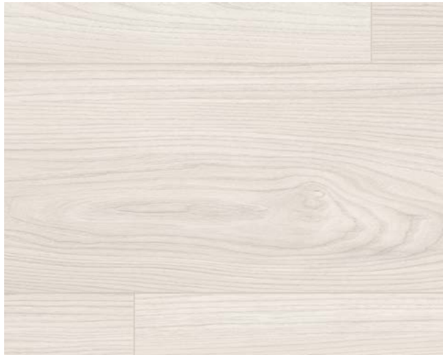
EL1003 Sheffield Akazie weiss Art.-No.: 566232 8/32 Classic Sockelleisten Art.-No.: 572325 8/33 Classic L610