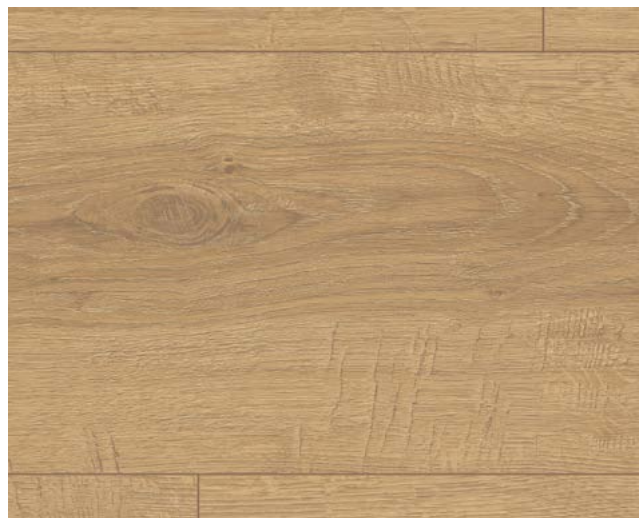
EL1007 Sherman Eiche honig