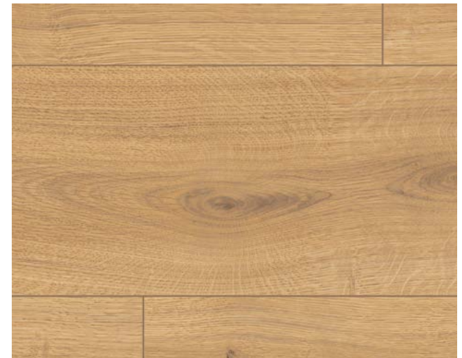
EL1005 Predaia Eiche honig Art.-No.: 566171 8/32 Classic Sockelleisten Art.-No.: 572264 8/33 Classic L613