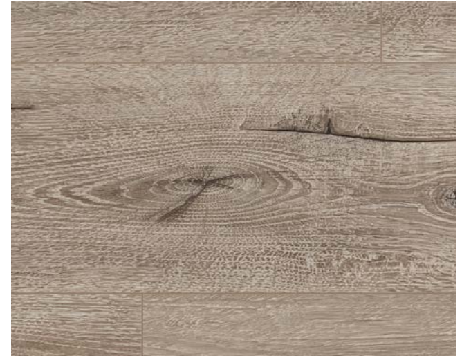
EL1006 Melba Eiche grau