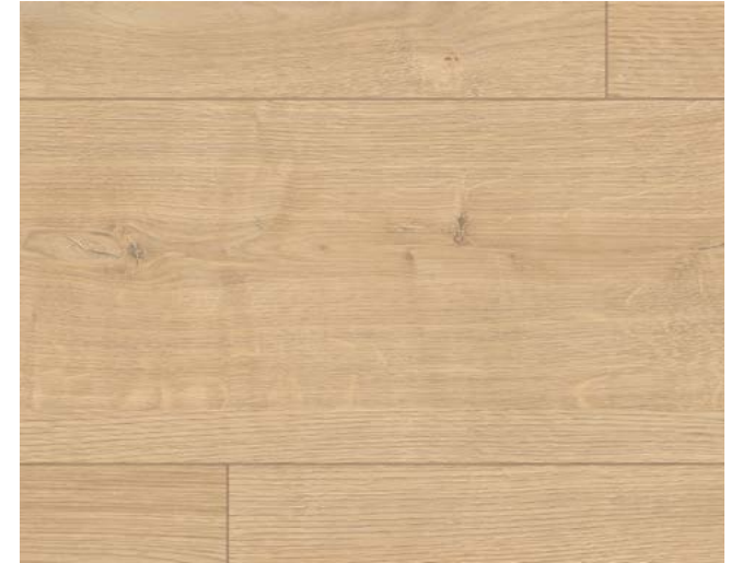
ED7001 Berdal Eiche hellbraun