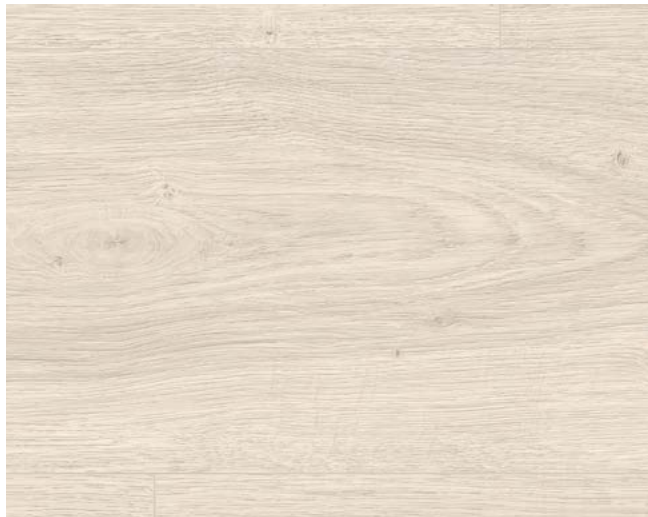
EL1008 Victoria Eiche weiss