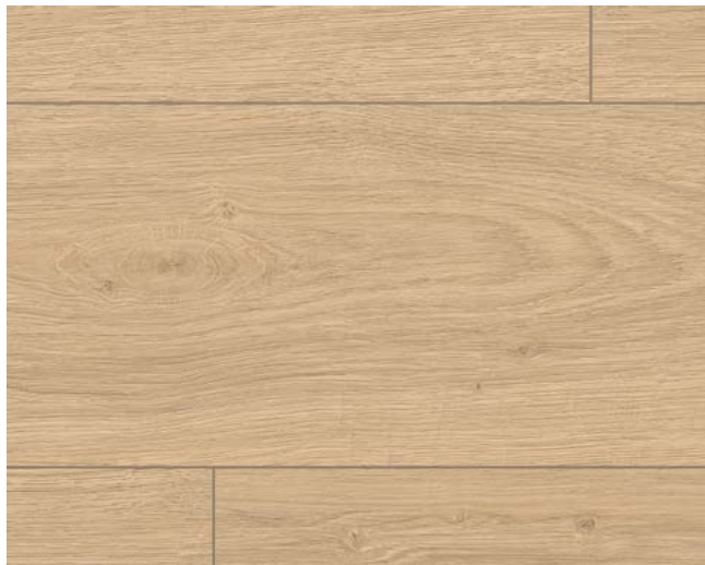
EL1009 Victoria Eiche natur Art.-No.: 566119 8/32 Classic Sockelleisten Art.-No.: 572387 8/33 Classic L612