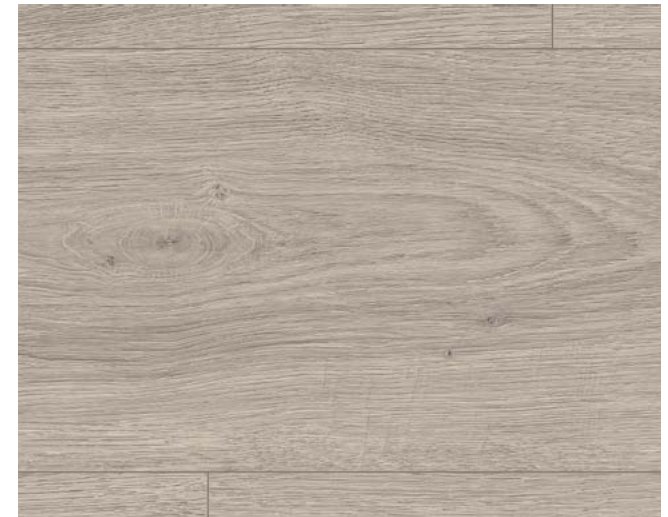
EL1010 Victoria Eiche hellgrau