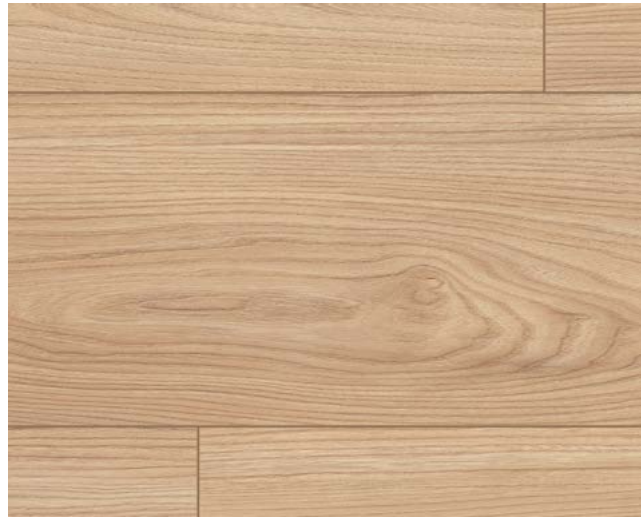
EL1004 Sheffield Akazie natur Art.-No.: 566201 8/32 Classic Sockelleisten Art.-No.: 572233 8/33 Classic L614