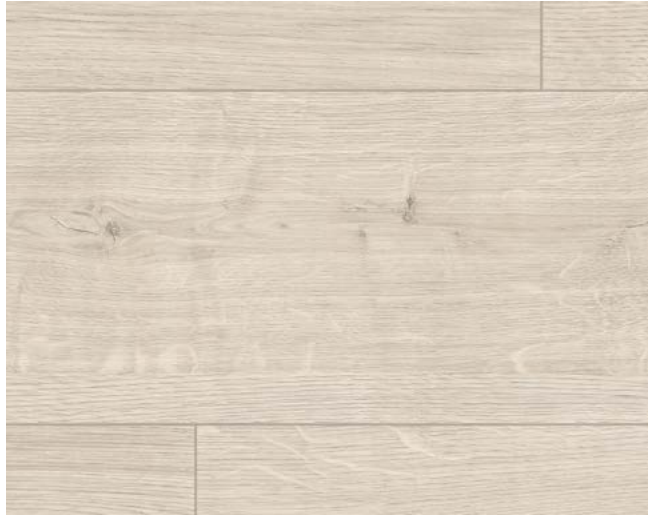
ED7000 Berdal Eiche weiss