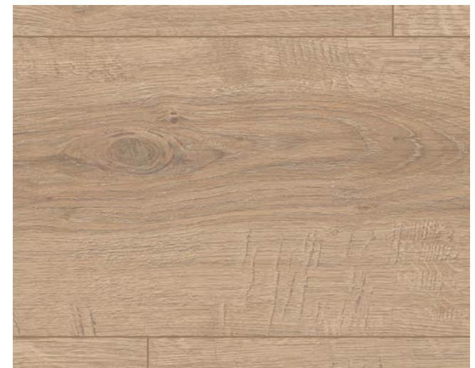
EL1012 Sherman Eiche braun