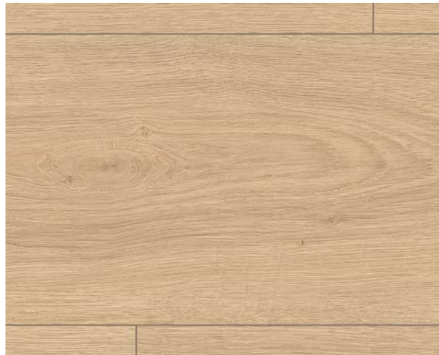
EL1009 Victoria Eiche natur