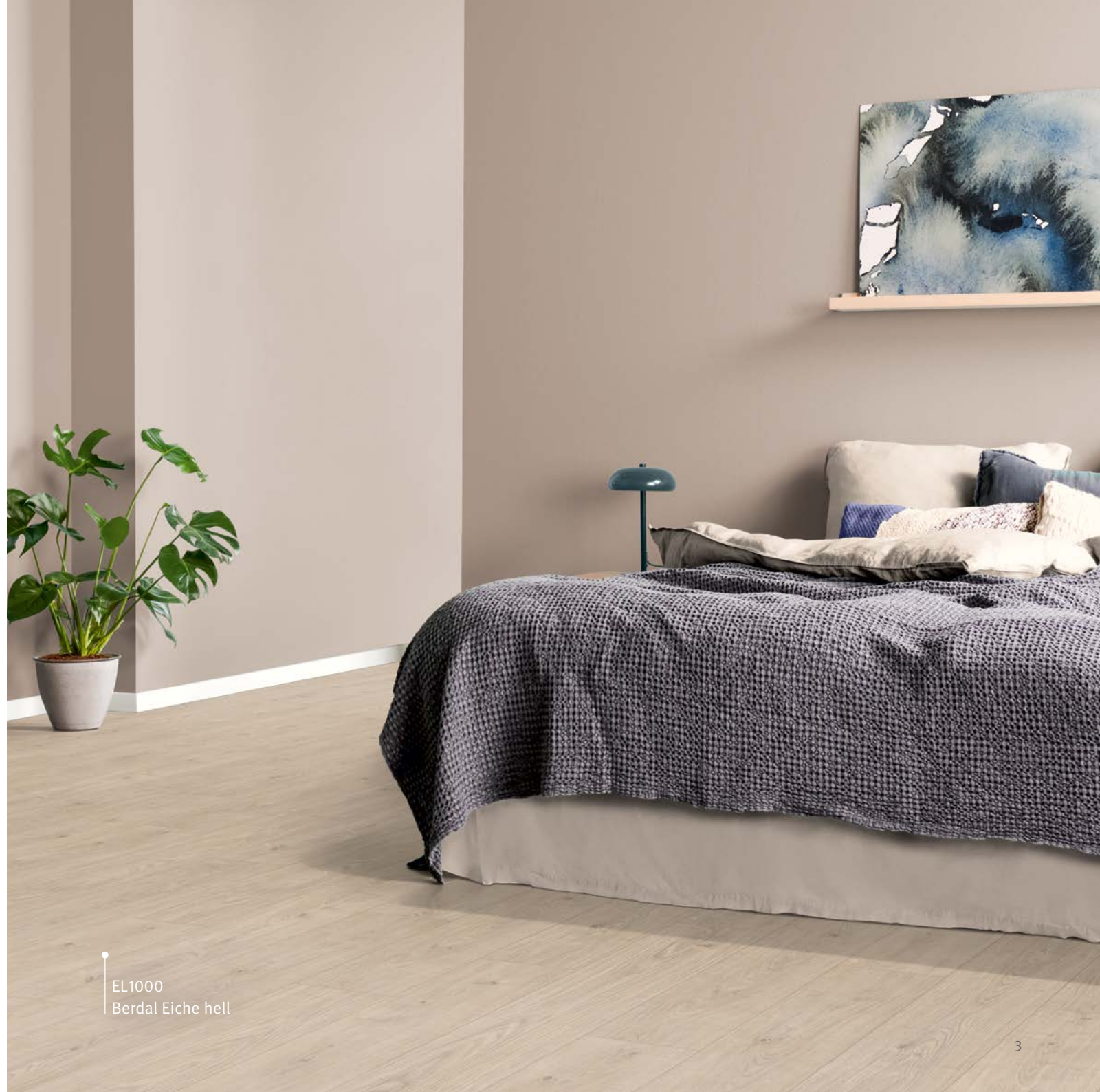
EL1000 Berdal Eiche hell

Ressourcenschonend und ökologisch: Das Holz für unseren Laminat-Boden kommt ausschließlich aus nachhaltiger Forstwirtschaft. Ein wertvoller Beitrag zu einem bewussten Umgang mit der Natur – und zu einem wohngesunden Raumklima. Das wird auch durch mehrere nationale und internationale Umweltzertifikate garantiert. Die Plattendicke von 7 mm ist nicht nur ressourcenschonend, sondern lässt sich auch gut auf vorhandenen Fliesenböden verlegen – damit ist es ein Top-Produkt für Renovierungsarbeiten.