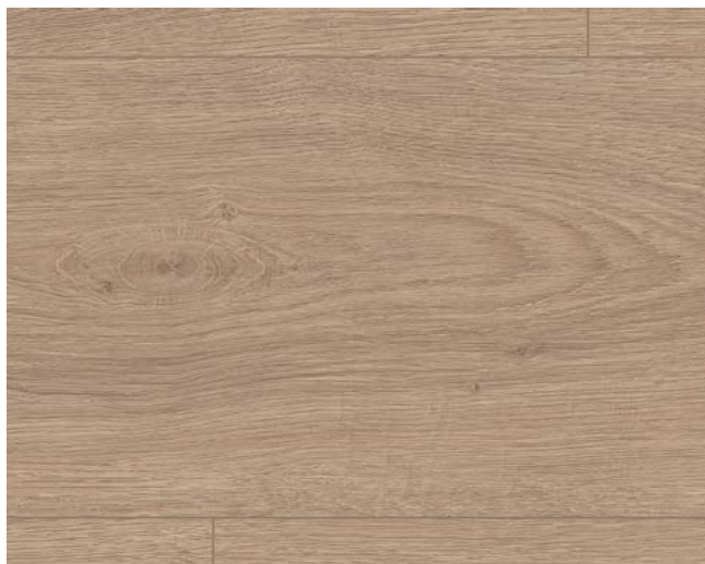
EL1011 Victoria Eiche braun