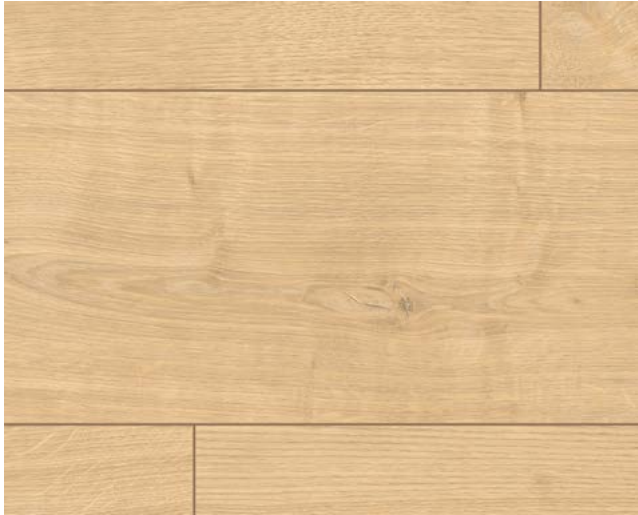
EL1002 Berdal Eiche hellbraun