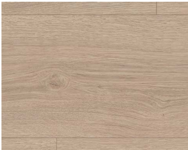
ED7002 Victoria Eiche hellbraun