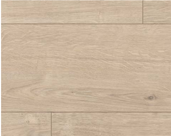
EL1000 Berdal Eiche hell