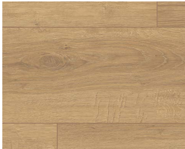
EL1007 Sherman Eiche honig Art.-No.: 566140 8/32 Classic Sockelleisten Art.-No.: 572356 8/33 Classic L624