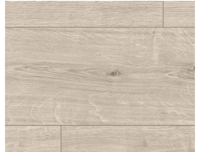
EL1001 Berdal Eiche grau Art.-No.: 566263 8/32 Classic Sockelleisten Art.-No.: 572295 8/33 Classic L611