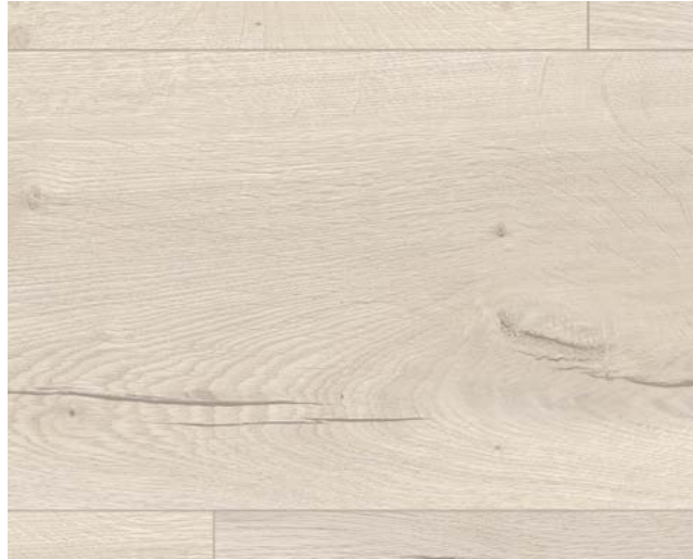
ED7003 Halifax Eiche creme