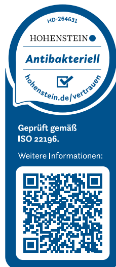
Beispiel: Zertifikat für Eurodekor

» Sämtliche Zertifikate finden Sie im Downloadbereich unter www.egger.com/antibakteriell