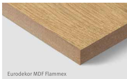
Eurodekor MDF Flammex