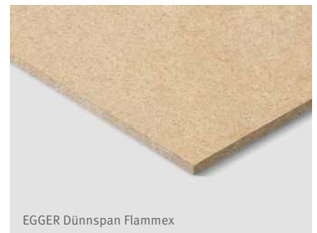
EGGER Dünnspon Flammex