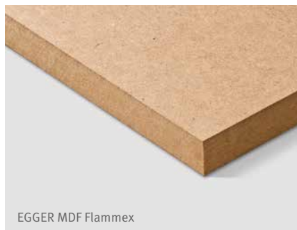
EGGER MDF Flammex