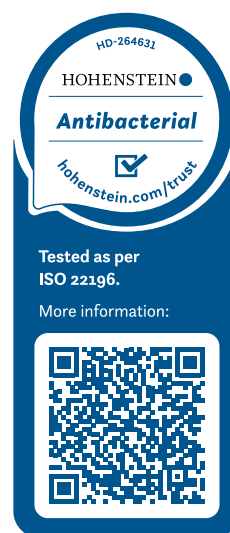
Pavyzdys: „Eurodekor“ sertifikatas

Mūsų produktai gaminami nenaudojant jokių antibakterinių priedų ir yra išbandyti taikant tarptautiniu mastu pripažintą bandymo metodą (ISO 22196 = JIS Z 2801) , siekiant įvertinti antibakterinį aktyvumą. Papildomai mūsų produktai sertifikuoti nepriklausomo „Hohenstein“ instituto .