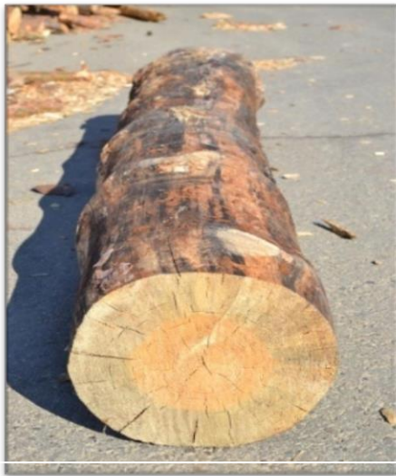
Lemn vechi, uscat / old, dry wood