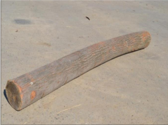
Curbura simpla / Simple curvature