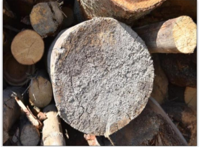
Lemn cu noroi / Wood with mud