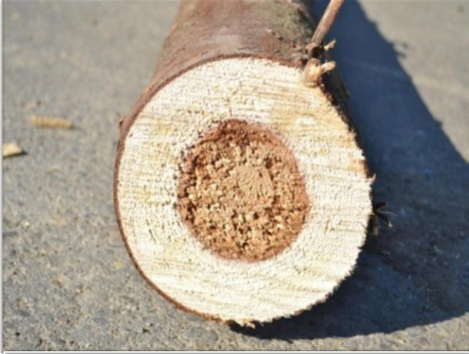
Putregai moale / Soft rot