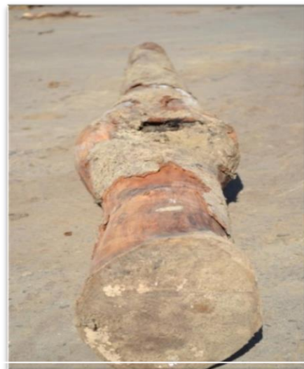
Umflaturi / Swellings