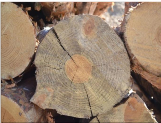
Albastreala / Blue stain