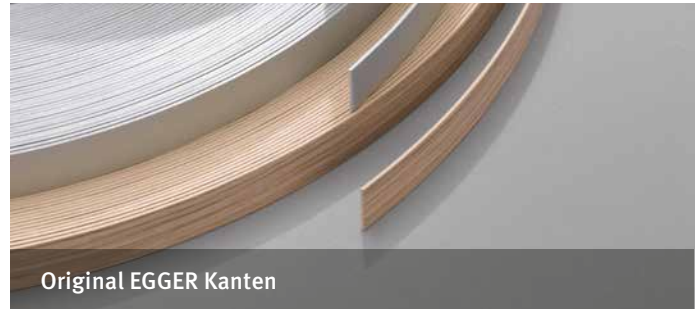
Original EGGER Kanten

sind die Komplettlösung für alle dekorativen Beschichtungen.