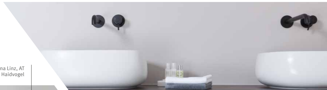
Cucina Linz, AT