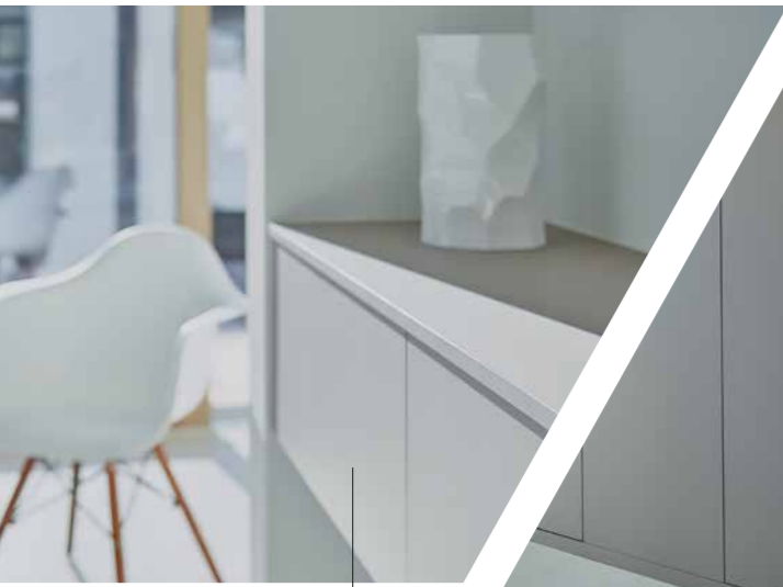
Abitazione unifamiliare Ismaning, DE