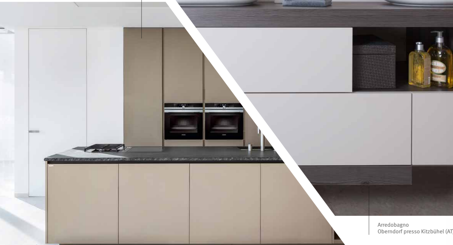
Arredobagno Oberndorf presso Kitzbühel (AT)

Grazie alle sue perfette caratteristiche ottiche e tattili, il prodotto è adatto a realizzare applicazioni pregiate per gli ambienti residenziali e commerciali, i negozi esclusivi e la produzione di mobili.