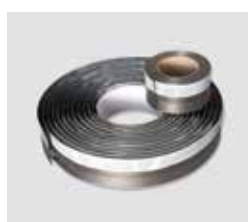
Aqua+ hliníková páska