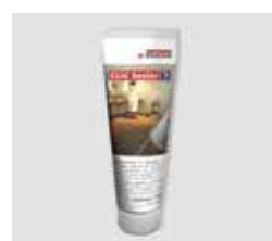
Aqua+ těsnění Clic Sealer