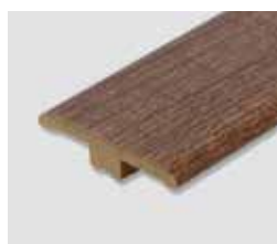
HDF podlahové profily