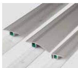
Hliníkové podlahové profily