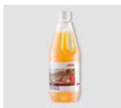
Čistič podlah Clean-it