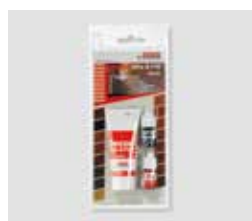
Sada na opravy Decor Mix & Fill