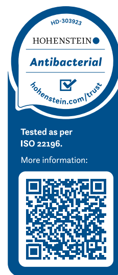
Certificat pour PerfectSense

Nos produits sont fabriqués sans additifs antibactériens et sont testés selon la principale méthode d'essai reconnue au niveau international (ISO 22196 = JIS Z 2801) pour évaluer l'action antibactérienne. En outre, nos produits sont certifiés par l'Institut Hohenstein, organisme externe et indépendant.