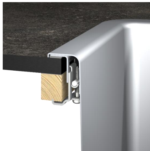
Rys. 2 – Blat roboczy z laminatu kompaktowego