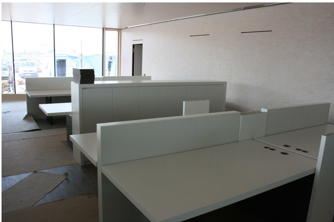
Abb. 5: Blick in die frisch möblierten Büros

Aus Gründen der Brandabschnittstrennung ist die Wand in Achse 5 des zentralen Treppenraums hochfeuerhemmend (F 60 bzw. REI 60) als Festverglasung und die Türen als T 60-RS Türen eingebaut.