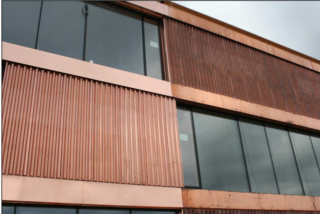
Abb. 2: Ansicht Außenwand U = 0,14 \text{ W/mK} Kupferfassade des Bürogebäudes in KW 27-2010

Dies betrifft auch T 30-Türen, die zum Teil als Rauchschutztüren T 30-RS eingebaut sind. Eine Branddurch- und Weiterleitung wird durch die entsprechenden Abschottungen S60 oder S30 verhindert. Ebenso sind im Bereich der hinterlüfteten Kupferblechfassade entsprechende Maßnahmen ausgeführt, die eine Brandweiterleitung in andere Geschosse verhindern. Unter anderem sind die horizontalen Deckenränder mit geschlossenen Blechen abgeschottet.