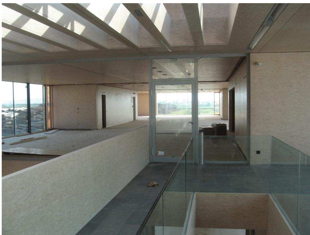
Abb. 7: Einbau der Brandschutzverglasung und Rauchschutztüren im Treppenbereich