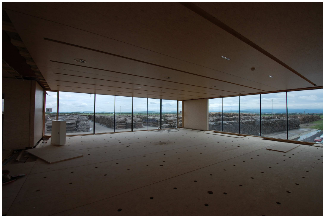
Abb. 6 Geschossdecke mit integrierter Heiz- und Kühltechnik