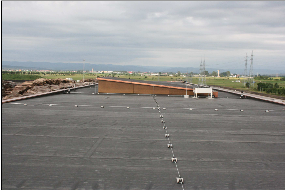
Abb. 4: Blitzschutzanlage auf der Dachfläche